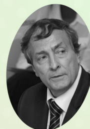
M. Luc -Joël GRÉGOIRE

SE Ministre de la Coopération et de l'Intégration Africaine