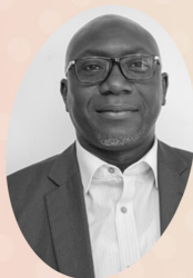
M. Cheikh Bamba FALL

SE M. le Ministre des Postes, Télécommunications, et de l'Economie Numérique