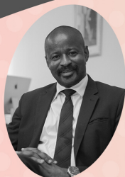
SE Moustapha Mamy DIABY

SE M. le Ministre des Postes, Télécommunications, et de l'Economie Numérique