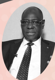
Dr Louceny NABÉ

Gouverneur de la Banque Centrale de la République de Guinée