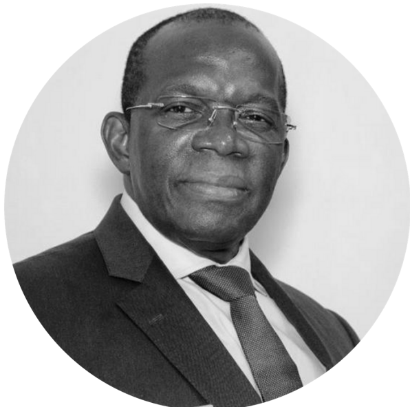
Son Excellence Dr. Ibrahima Kassory FOFANA Premier ministre de la République de Guinée