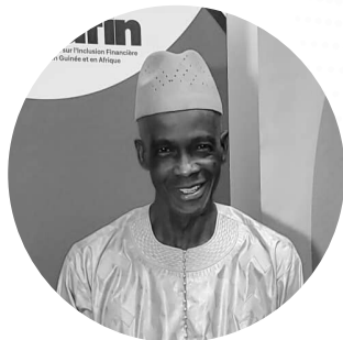
El Hadj Kemo CONDÉ

DG de la Supervision des Institutions Financières BCRG